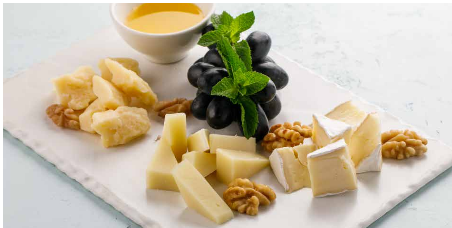
СЫРНАЯ ТАРЕЛКА 1590 ₺ Пармезан, бри, пекорино CHEESE PLATE (parmesan, brie, pecorino)