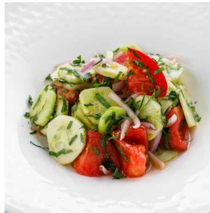
ДОМАШНИЙ САЛАТ ИЗ ПОМИДОРОВ, ОГУРЦОВ, ЛУКА И ЗЕЛЕНИ HOMEMADE SALAD WITH TOMATOES, CUCUMBERS, ONIONS AND HERBS