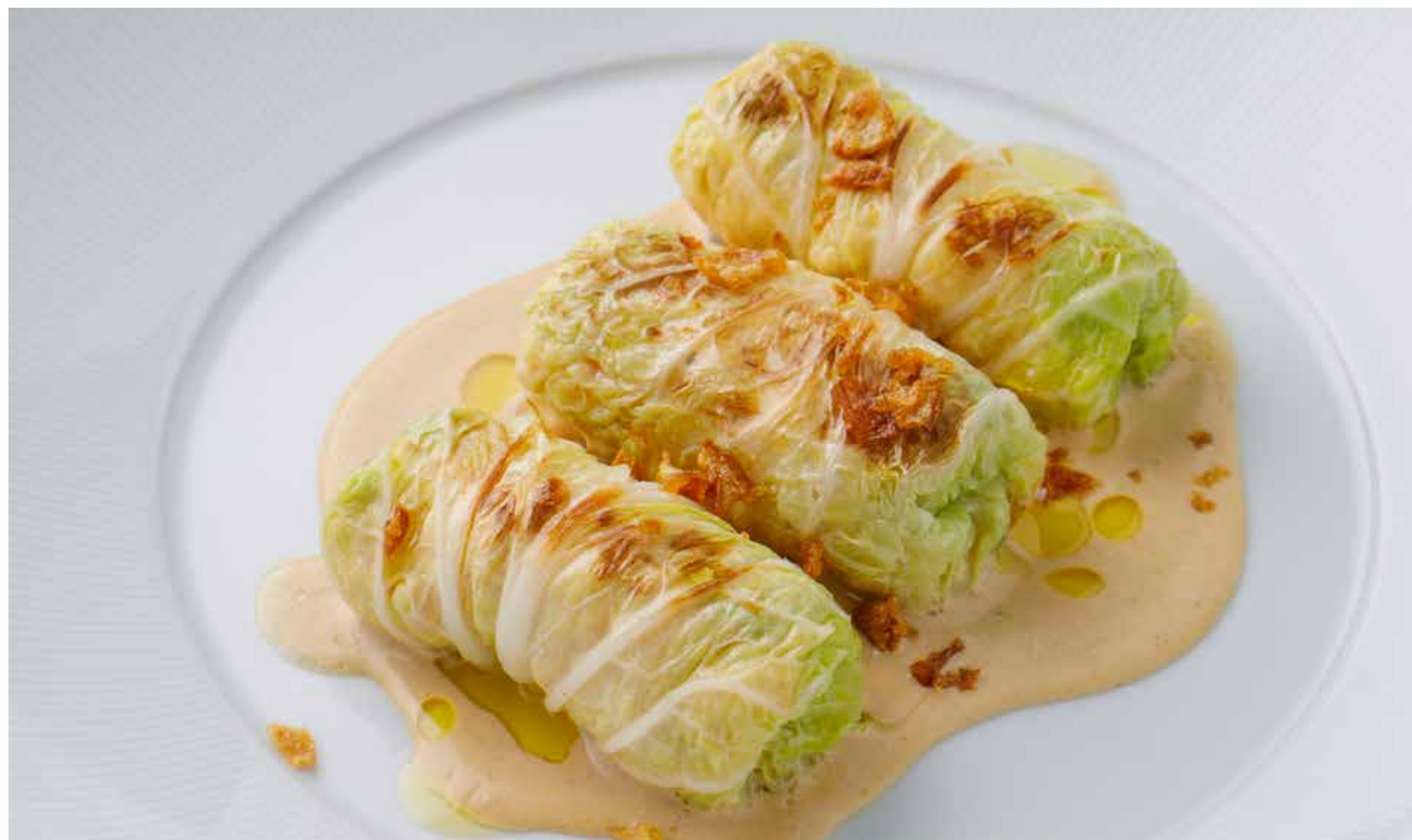
ГОЛУБЦЫ ИЗ РАКОВЫХ ШЕЕК CABBAGE ROLLS WITH CANCER NECKS