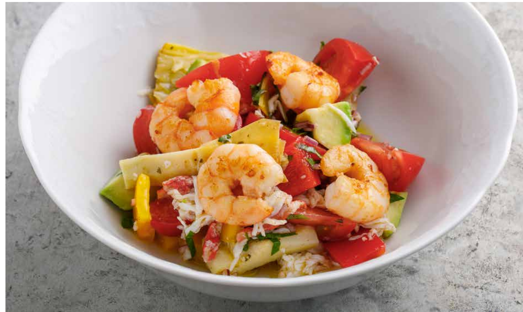
СРЕДИЗЕМНОМОРСКИЙ САЛАТ MEDITERRANEAN SALAD