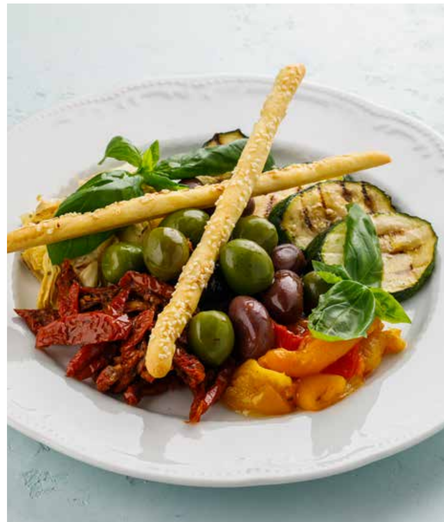
АНТИПАСТИ 1490 ₺ Вяленые томаты, оливки, маслины, артишоки ANTIPASTI (dried tomatoes, olives, artichoke)