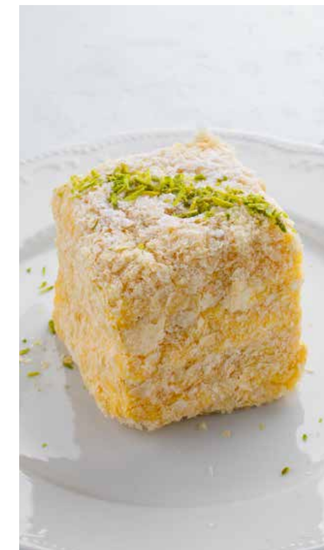
«НАПОЛЕОН» "NAPOLEON" CAKE