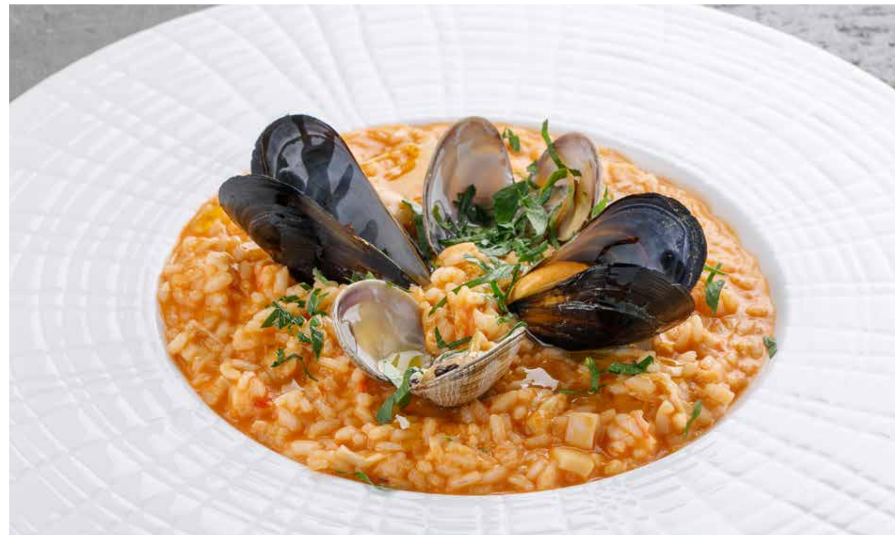
РИЗОТТО С МОРЕПРОДУКТАМИ RISOTTO WITH SEAFOOD