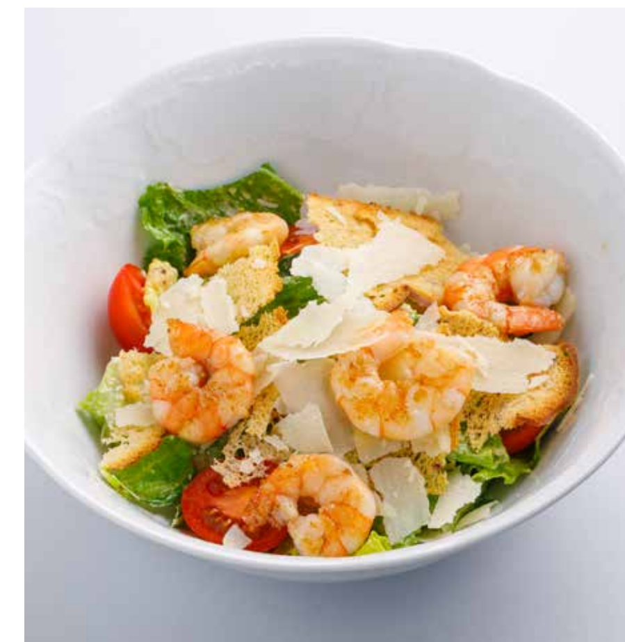
«ЦЕЗАРЬ» С КРЕВЕТКОЙ / С ЦЫПЛЕНКОМ CAESAR SALAD WITH SHRIMP / CHICKEN