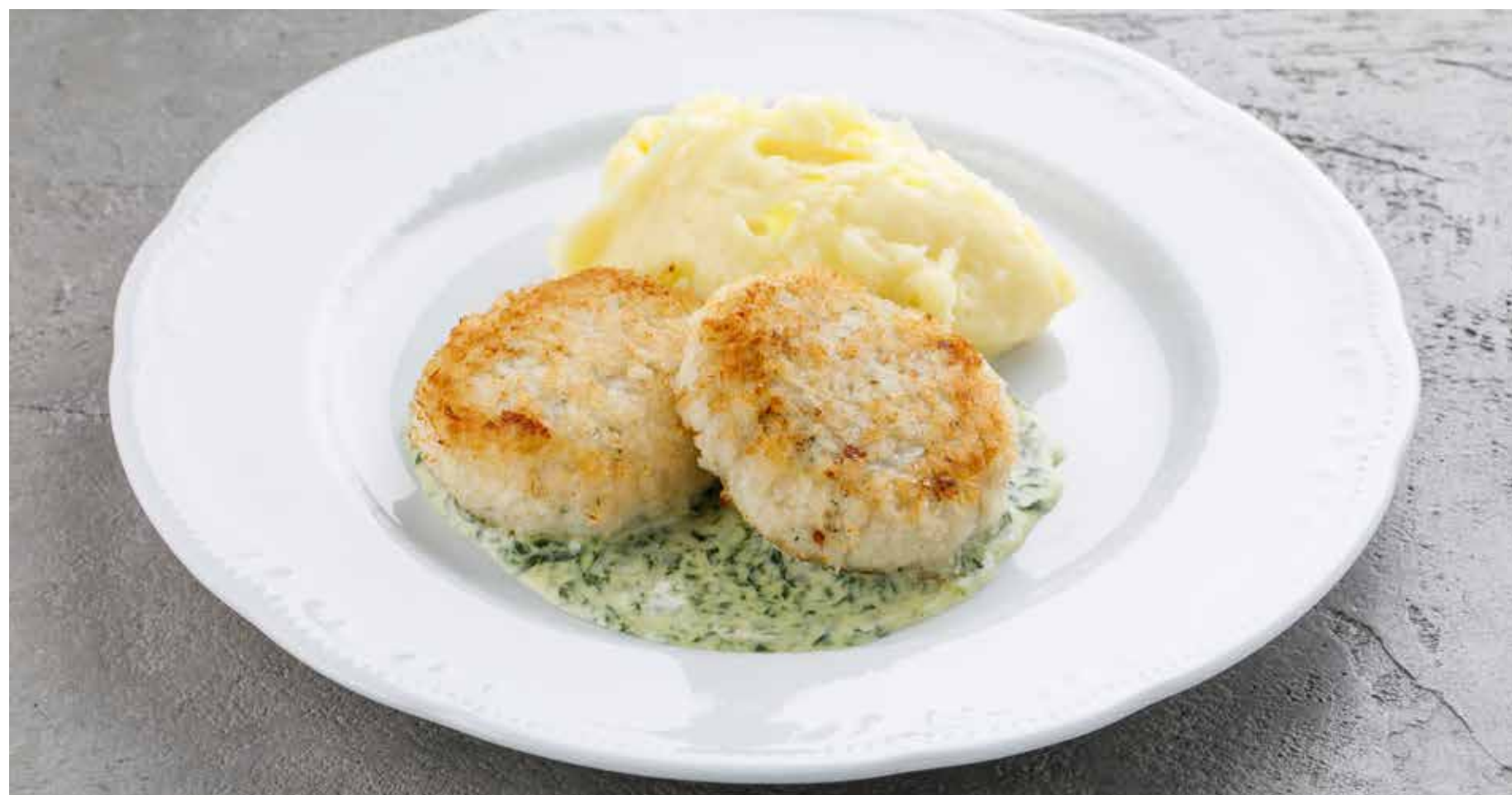
НЕЖНЫЕ КОТЛЕТЫ ИЗ ТРЕСКИ DELICATE COD PATTIES