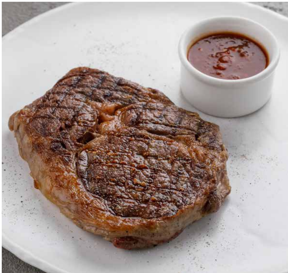
СТЕЙК РИБАЙ С СОУСОМ NEW YORK 3890 ₺ RIBEYE STEAK WITH NEW YORK SOUCE