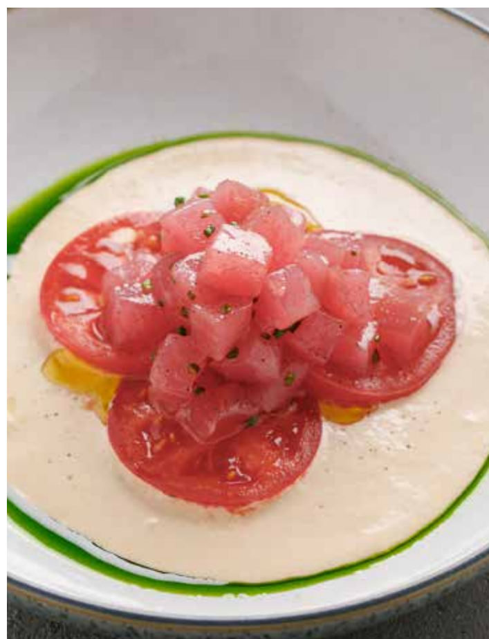
ТАРТАР ИЗ ТУНЦА С СОУСОМ ТОННАТО 1290 ₺ TUNA TARTARE WITH TONNATO SAUCE