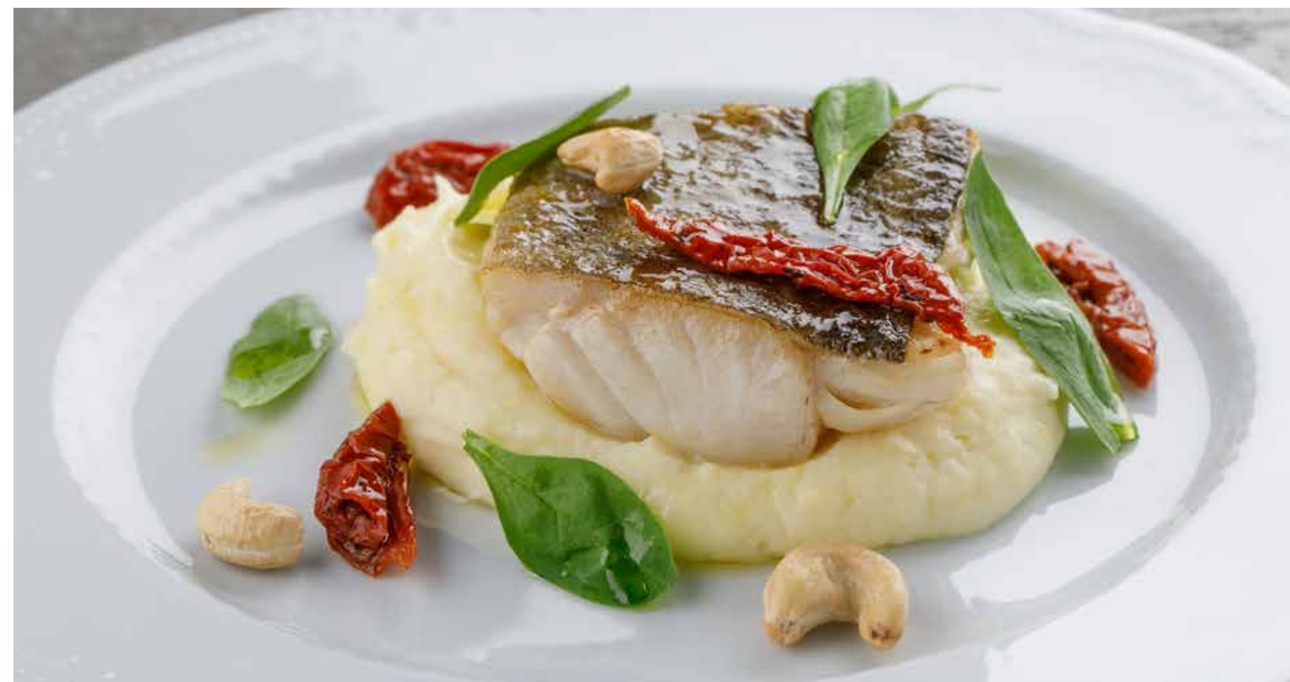
МУРМАНСКАЯ ТРЕСКА MURMANSK COD