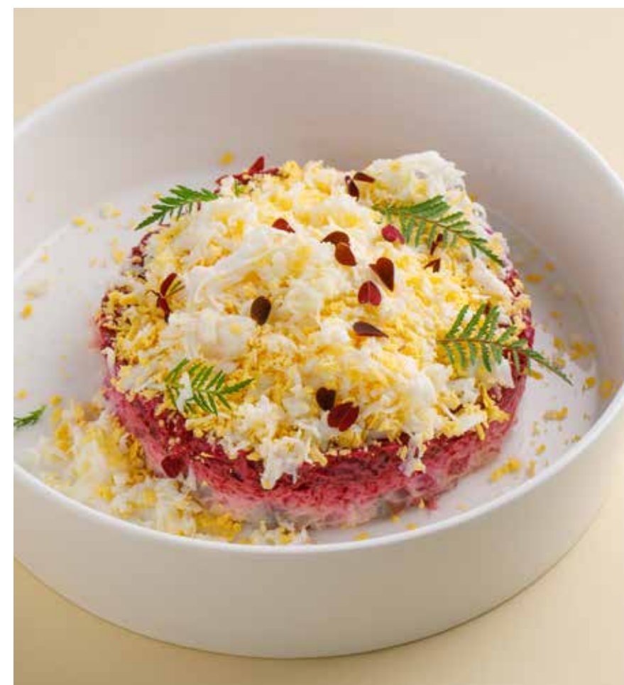
«СЕЛЬДЬ ПОД ШУБОЙ» RUSSIAN DRESSED HERRING