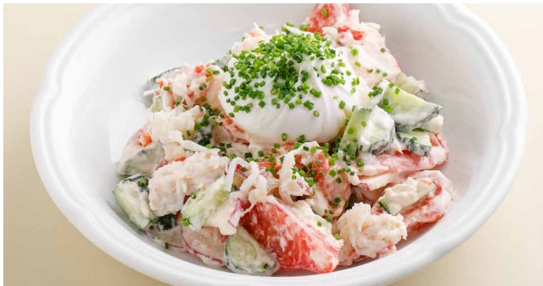
ОВОЩНОЙ САЛАТ С ЯЙЦОМ ПАШОТ, СМЕТАНОЙ И КРАБОМ VEGETABLE SALAD WITH POACHED EGG, SOUR CREAM AND CRAB