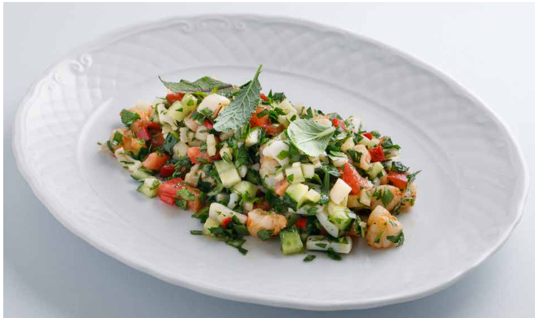
ОВОЩНОЙ САЛАТ С МОРЕПРОДУКТАМИ VEGETABLE SALAD WITH SEAFOOD