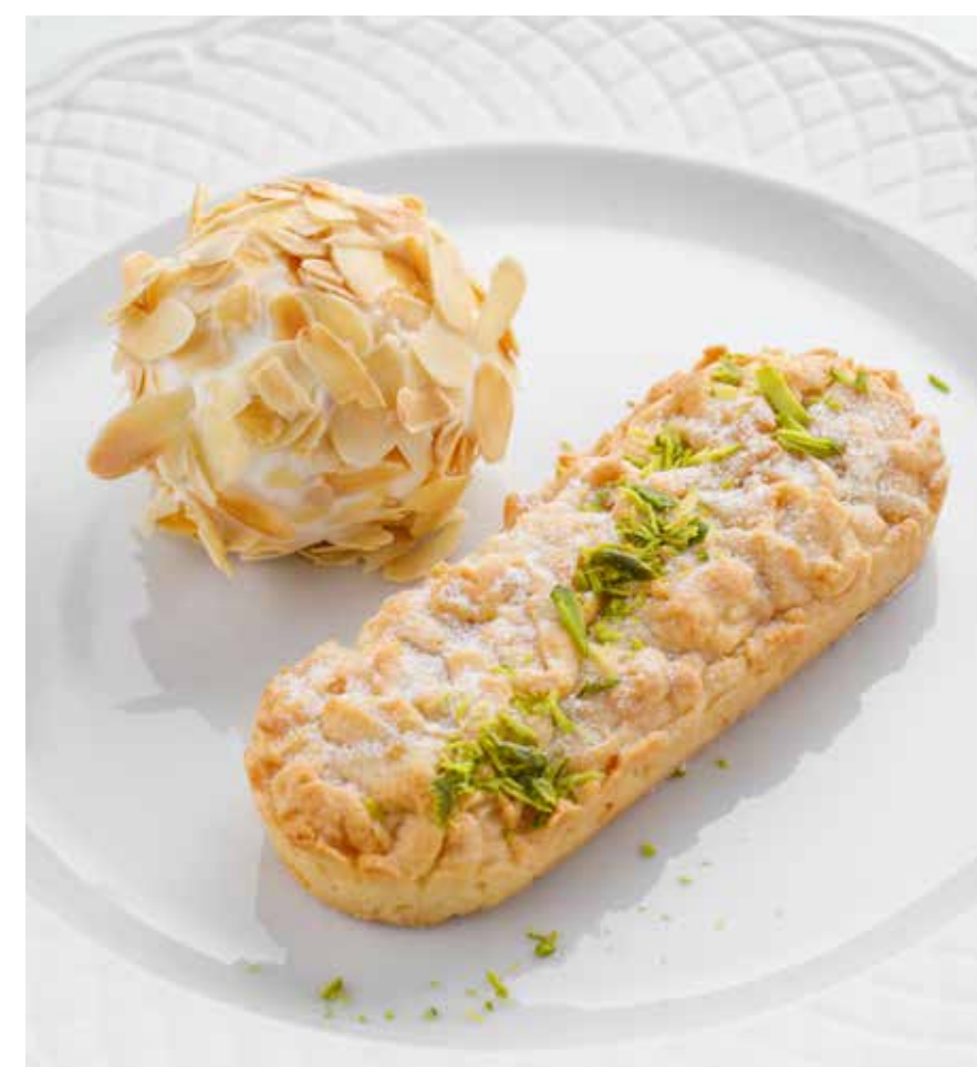
ТЕПЛЫЙ ЛИМОННЫЙ ТАРТ С СОРБЕТОМ WARM LEMON TART WITH SORBET