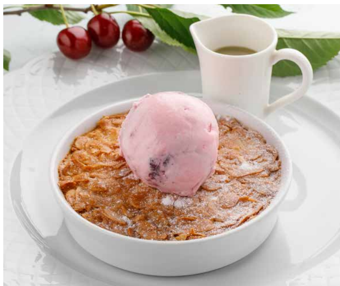
ЧЕРЕШНЕВЫЙ ПИРОГ С ФИСТАШКОВЫМ СОУСОМ SWEET CHERRY PIE WITH PISTACHIO SAUCE