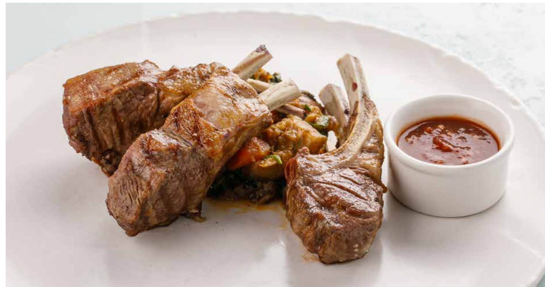
КАРЕ ЯГНЕНКА 3490 ₺ RACK OF LAMB