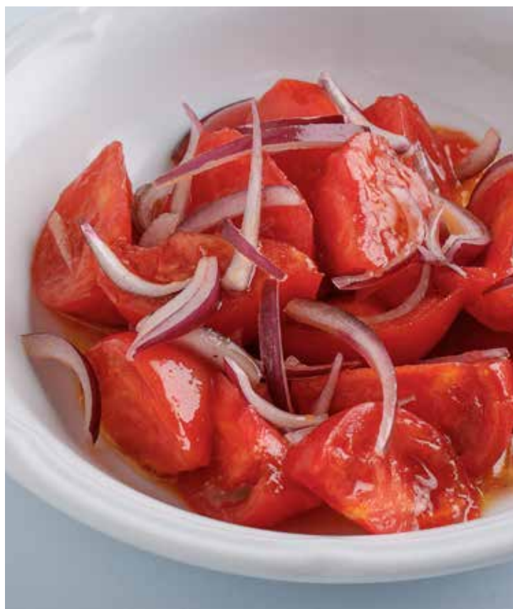
САЛАТ ИЗ БАКИНСКИХ ТОМАТОВ С ЯЛТИНСКИМ ЛУКОМ BAKU TOMATO SALAD WITH CRIMEAN ONIONS