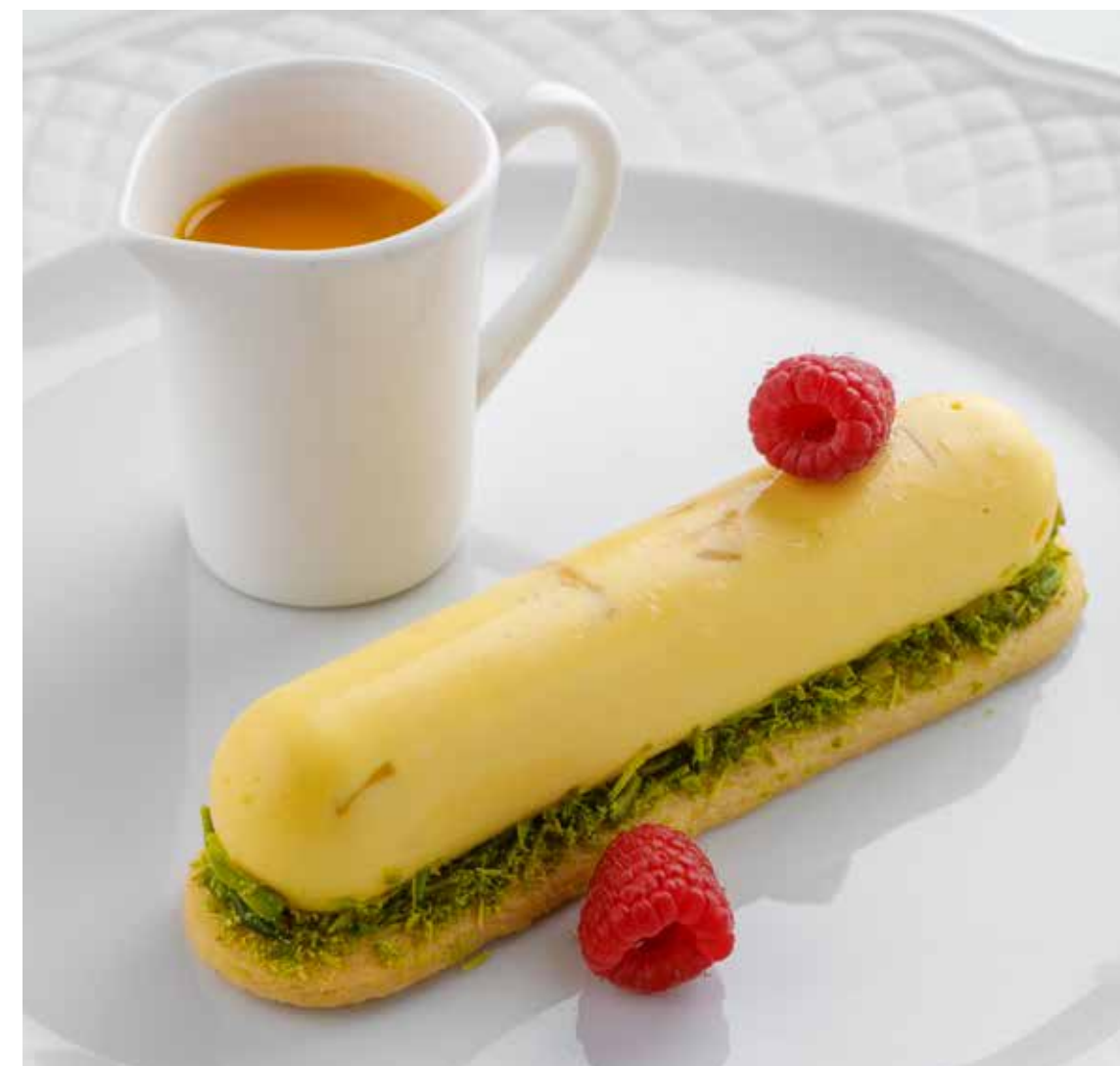
ТРОПИЧЕСКИЙ ДЕСЕРТ С МАНГО TROPICAL DESSERT WITH MANGO