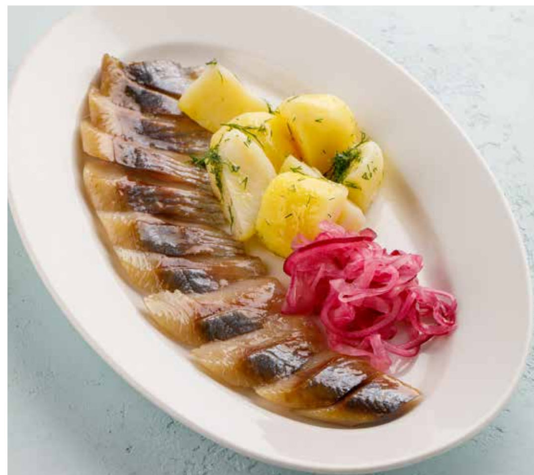
ОЛЮТОРСКАЯ СЕЛЬДЬ С КАРТОФЕЛЕМ 690 ₺ OLYUTOR HERRING WITH POTATOES