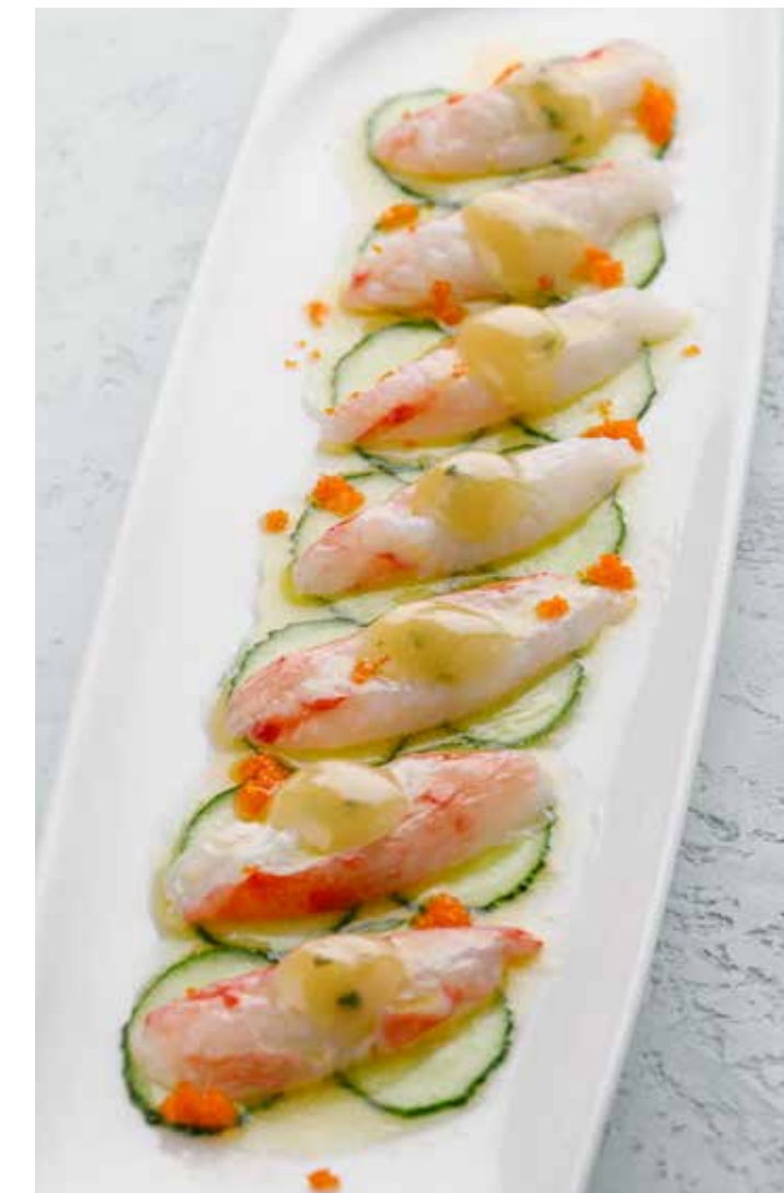
САШИМИ ИЗ КРАБА 1690 ₺ CRAB SASHIMI