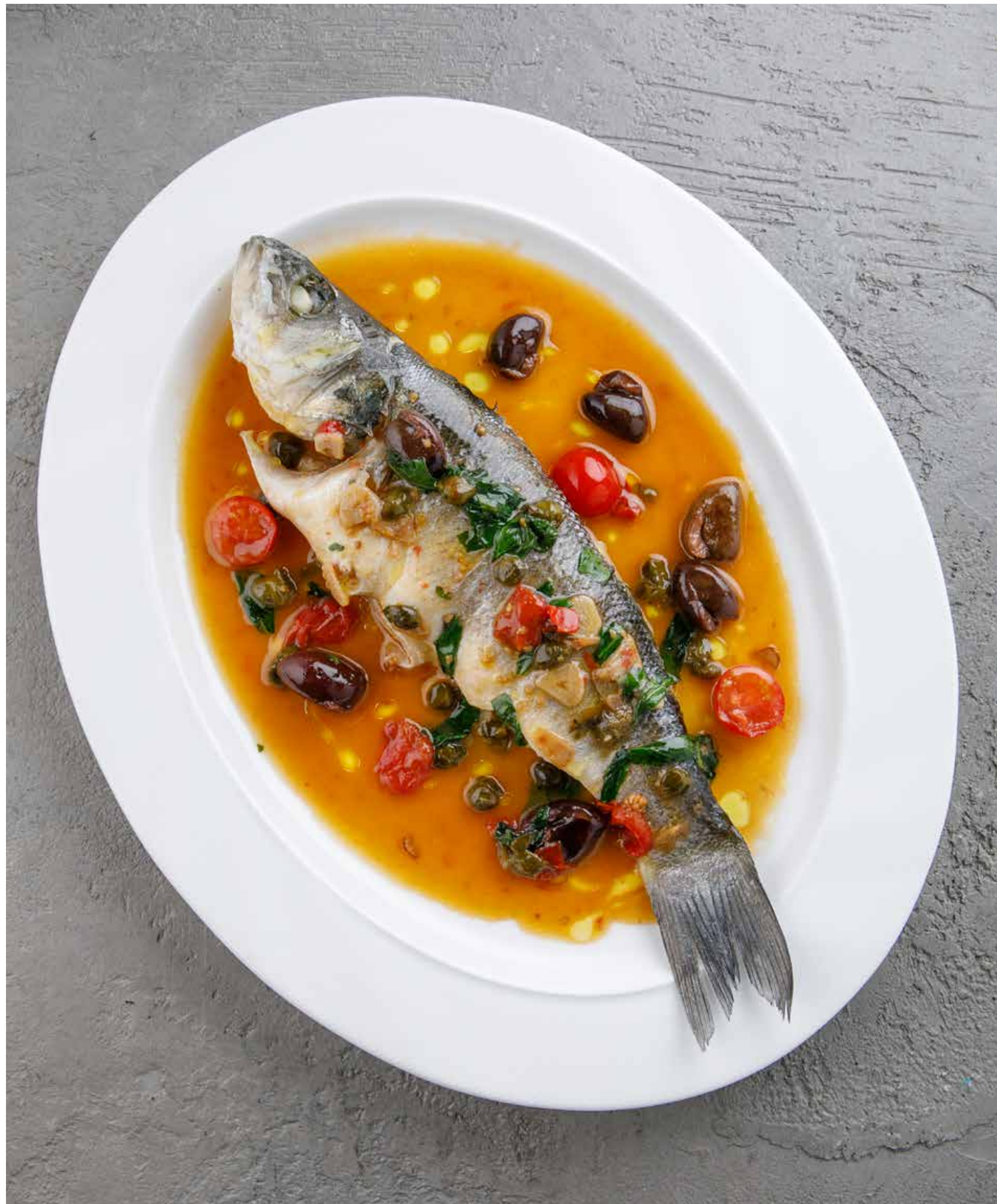
СИБАС «АКВА ПАЦЦА» SEABASS ACQUA PAZZA