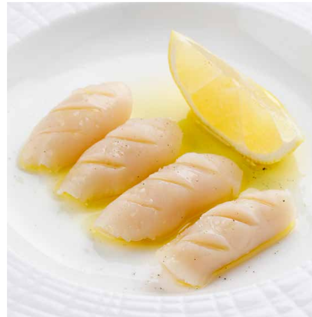
КРУДО ИЗ ДАЛЬНЕВОСТОЧНОГО ГРЕБЕШКА 890 ₺ CRUDO FROM THE FAR EASTERN SCALLOP