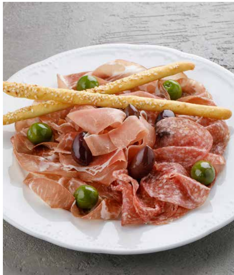
АССОРТИ ИЗ МЯСНЫХ ДЕЛИКАТЕСОВ 1990 ₺ Коппа, салями милано, парма ASSORTED MEAT DELICACIES (coppa, salami milano, parma)