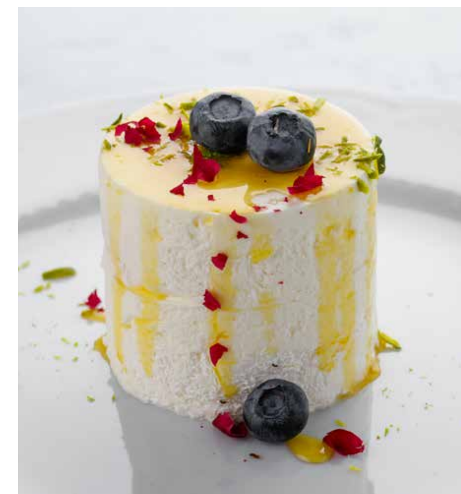
«СМЕТАННИК» С ЯГОДАМИ SOUR CREAM WITH BERRIES