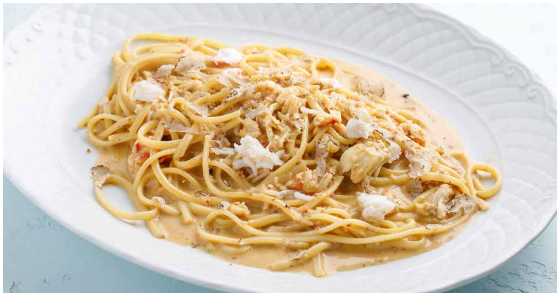
«КРАБОНАРА» С КРАБОМ И ТРЮФЕЛЕМ CRABONARA WITH CRAB AND TRUFFLE