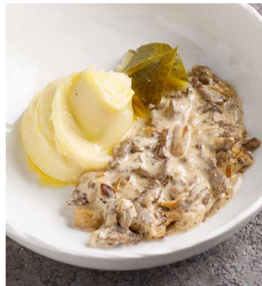
БЕФСТРОГАНОВ С ГРИБАМИ BEEF STROGANOFF WITH MUSHROOMS