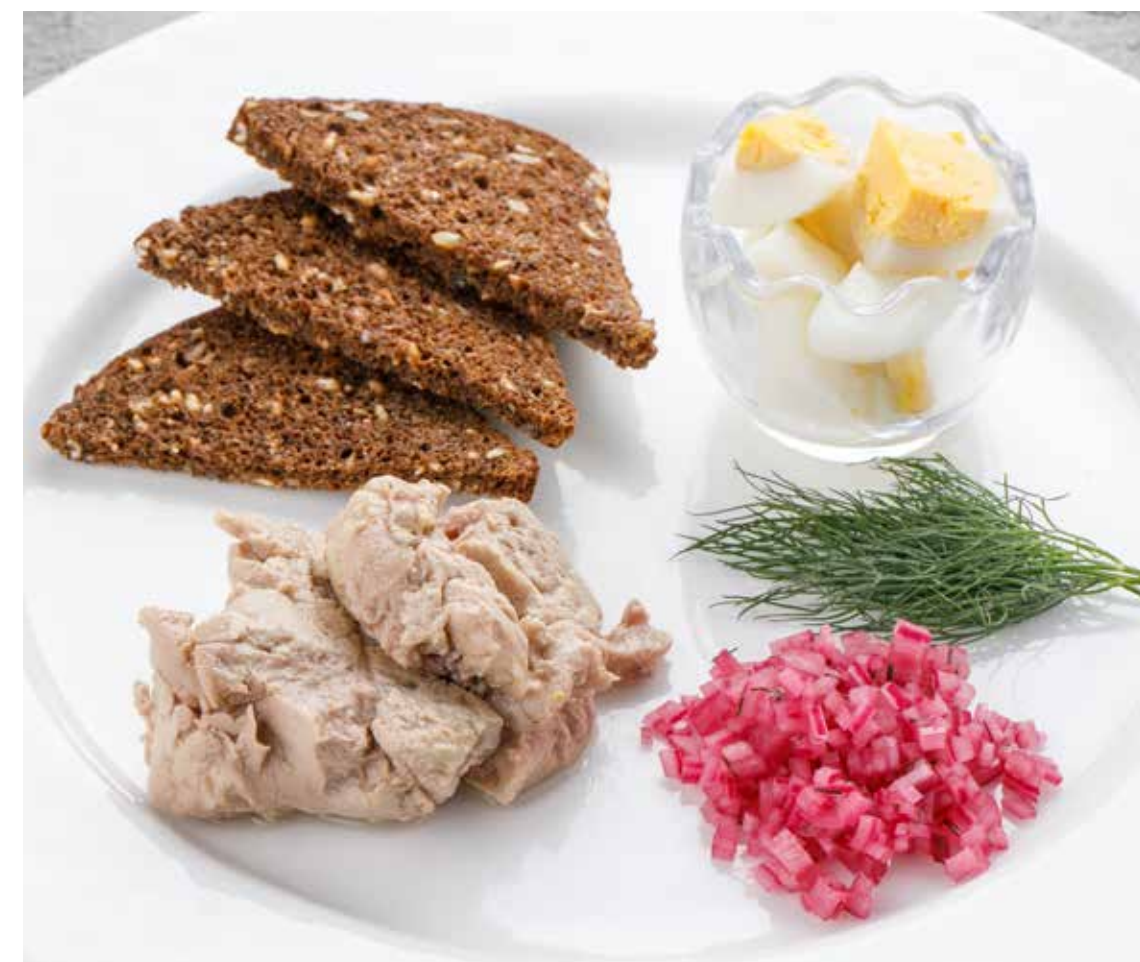
ПЕЧЕНЬ ТРЕСКИ С ТОСТАМИ И ЯЙЦОМ 790 ₺ COD LIVER WITH TOAST AND EGG