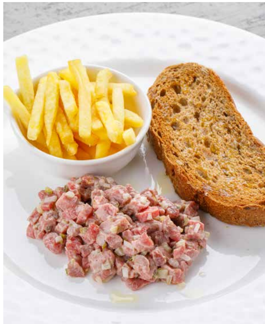
ТАРТАР ИЗ ГОВЯДИНЫ С КАРТОФЕЛЕМ ФРИ 990 ₺ BEEF TARTARE WITH FRENCH FRIES