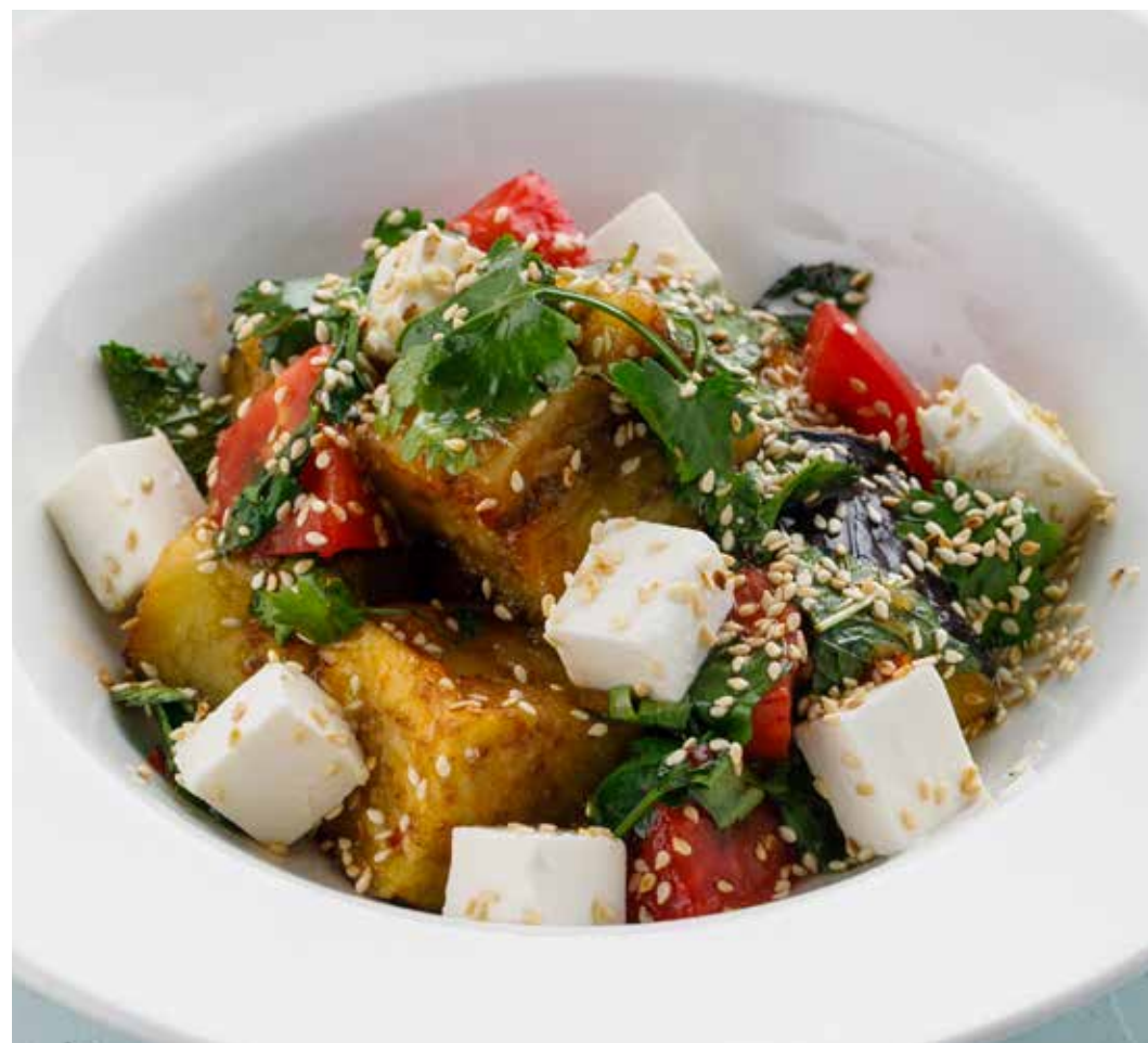
САЛАТ С БАКЛАЖАНАМИ И ФЕТОЙ EGGPLANT AND FETA SALAD