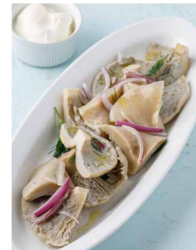
ГРУЗДИ БЕЛЫЕ С ЯЛТИНСКИМ ЛУКОМ И СМЕТАНОЙ 690 ₺ WHITE GRUZDI MUSHROOMS WITH CRIMEAN ONIONS AND SOUR CREAM