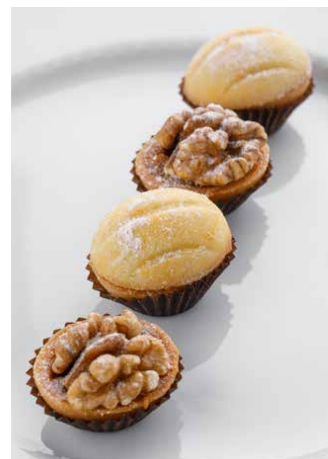
ОРЕШКИ С ВАРЕНОЙ СГУЩЕНКОЙ NUTS WITH BOILED CONDENSED MILK