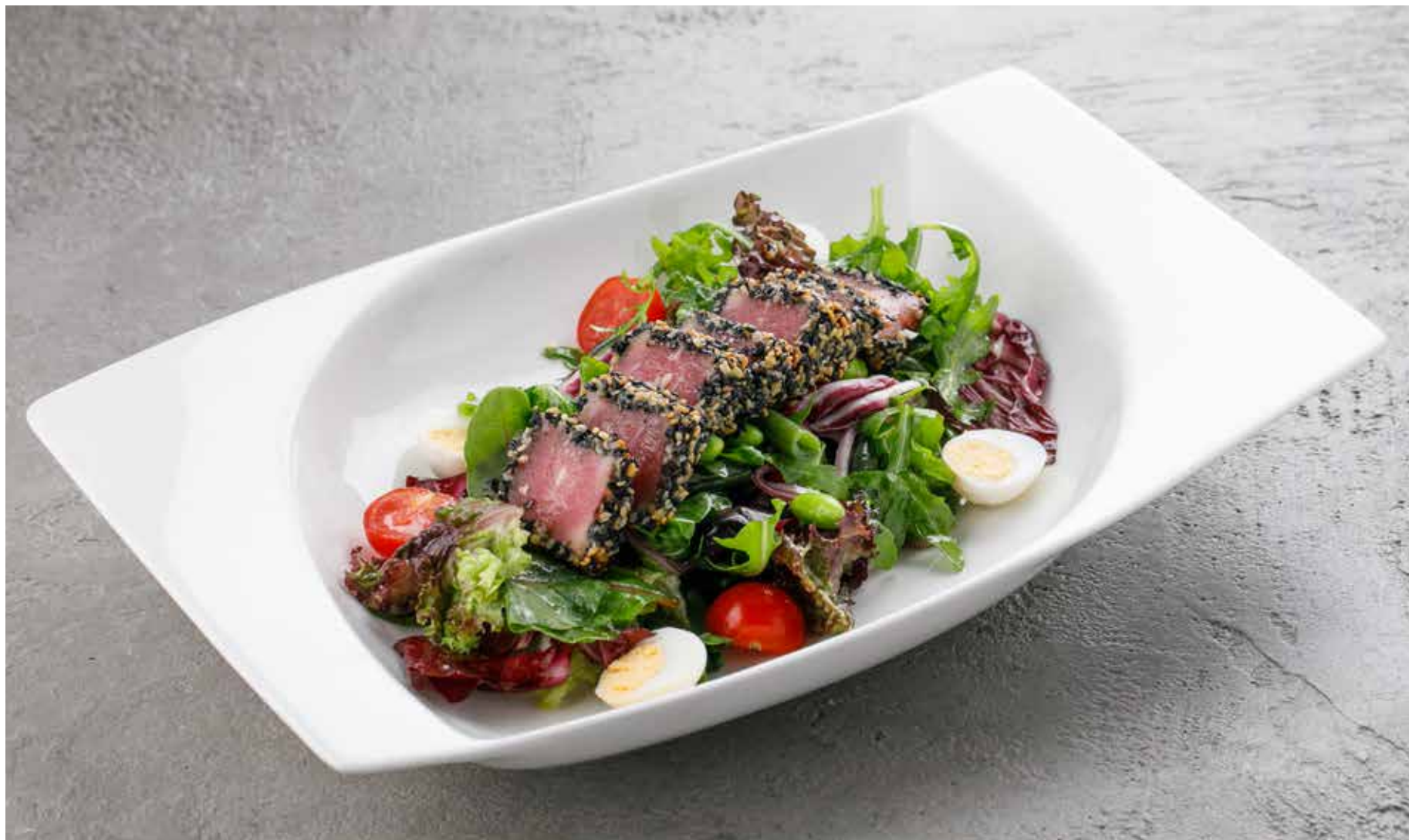
«НИСУАЗ» NICOISE SALAD