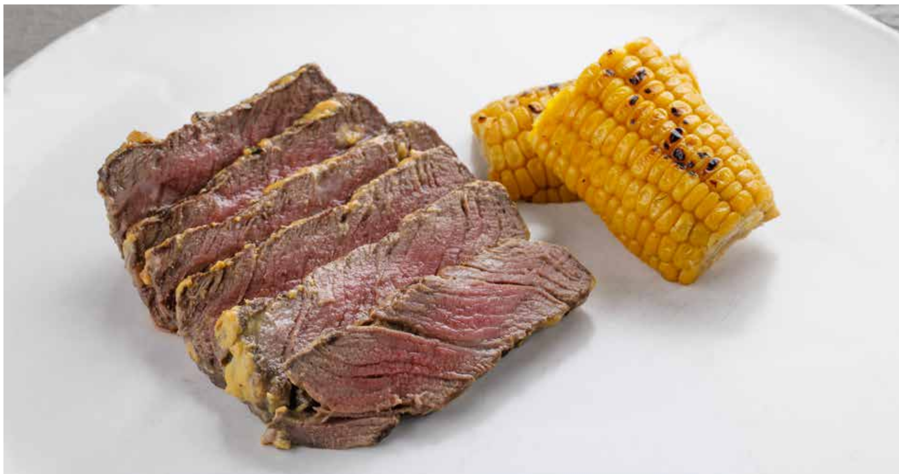
ФИЛЕ ГОВЯДИНЫ В ГОРЧИЧНОМ СОУСЕ 3990 ₺ BEEF FILLET IN MUSTARD SAUCE