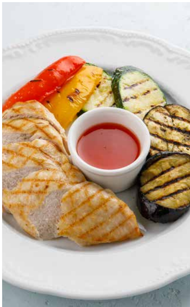
КУРИНАЯ ГРУДКА С ОВОЩАМИ 990 ₺ CHICKEN BREAST WITH GRILLED VEGETABLES