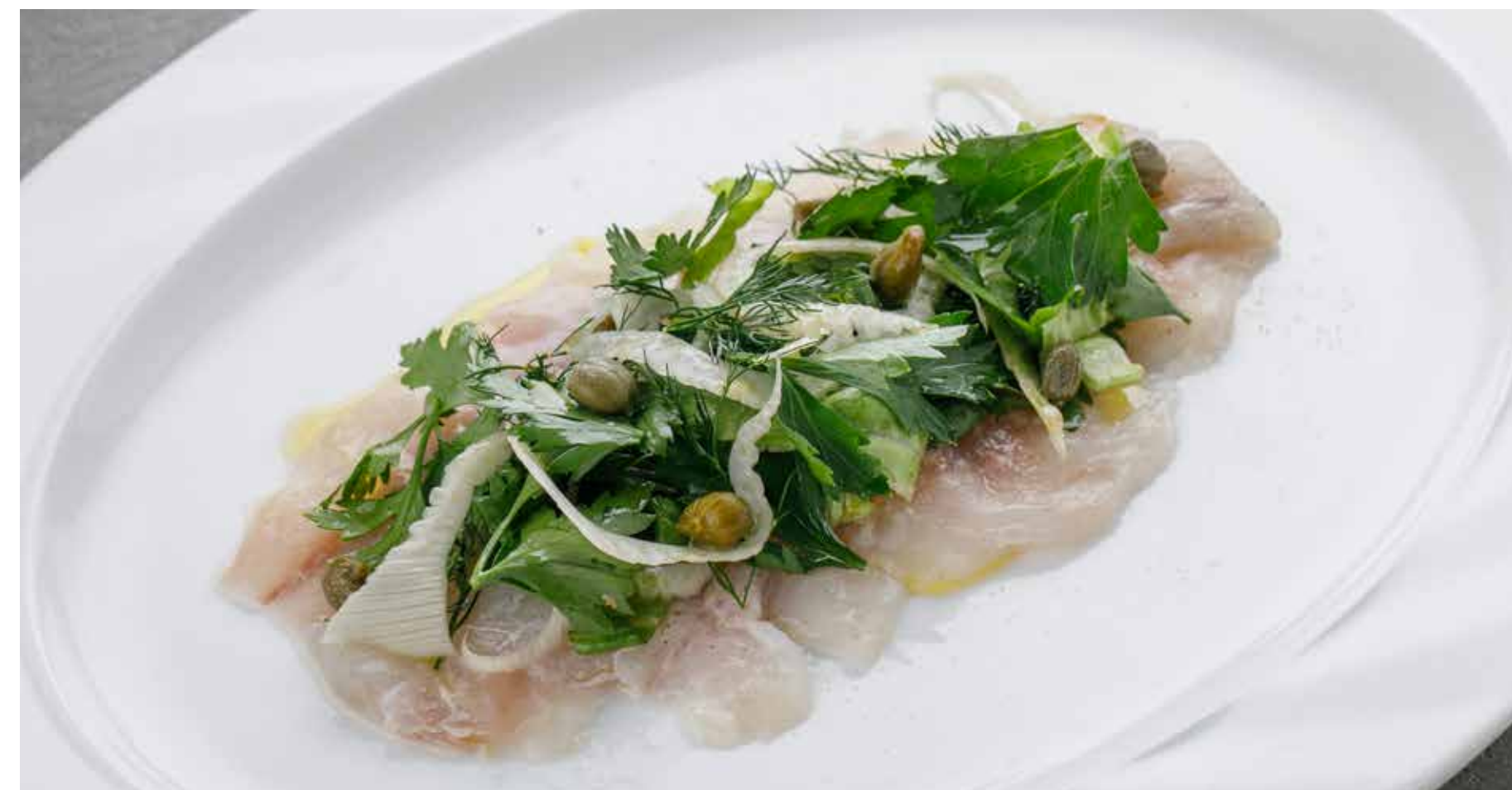
СЕВИЧЕ ИЗ СИБАСА 990 ₺ SEABASS CEVICHE