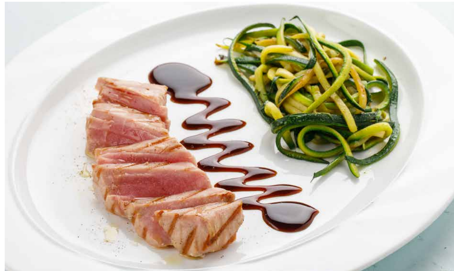
СТЕЙК ИЗ ТУНЦА С ЛАПШОЙ ИЗ ЦУКИНИ 1590 ₺ TUNA STEAK WITH ZUCCHINI NOODLES