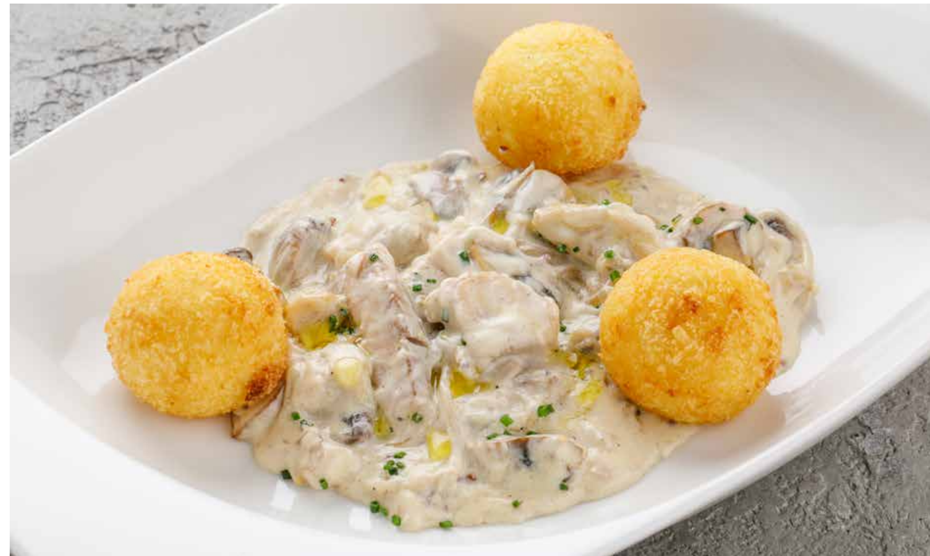
ОСЕТРИНА ПО-СТРОГАНОВСКИ STURGEON IN STROGANOFF STYLE