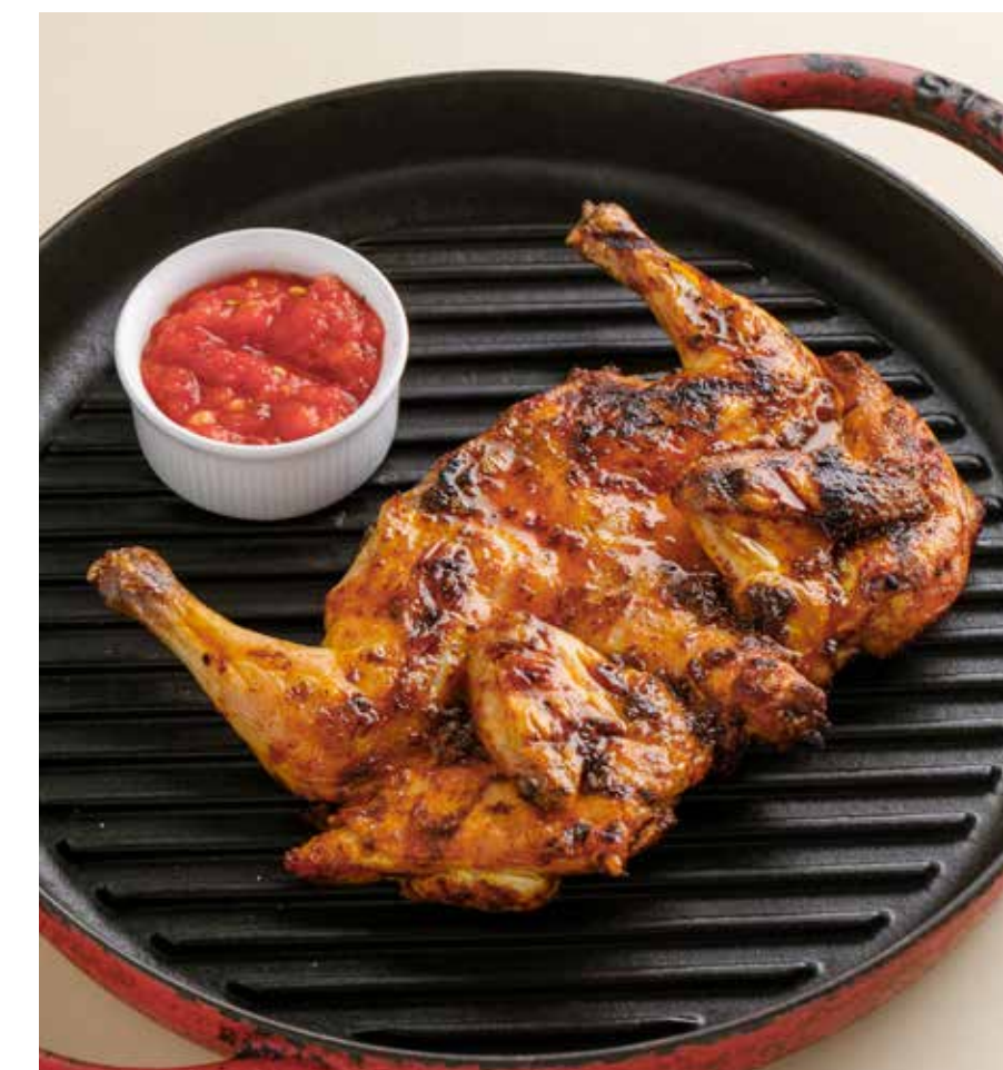
ЦЫПЛЕНОК КОРНИШОН С АДЖИКОЙ CORNICHON CHICKEN WITH ADJIKA SAUCE