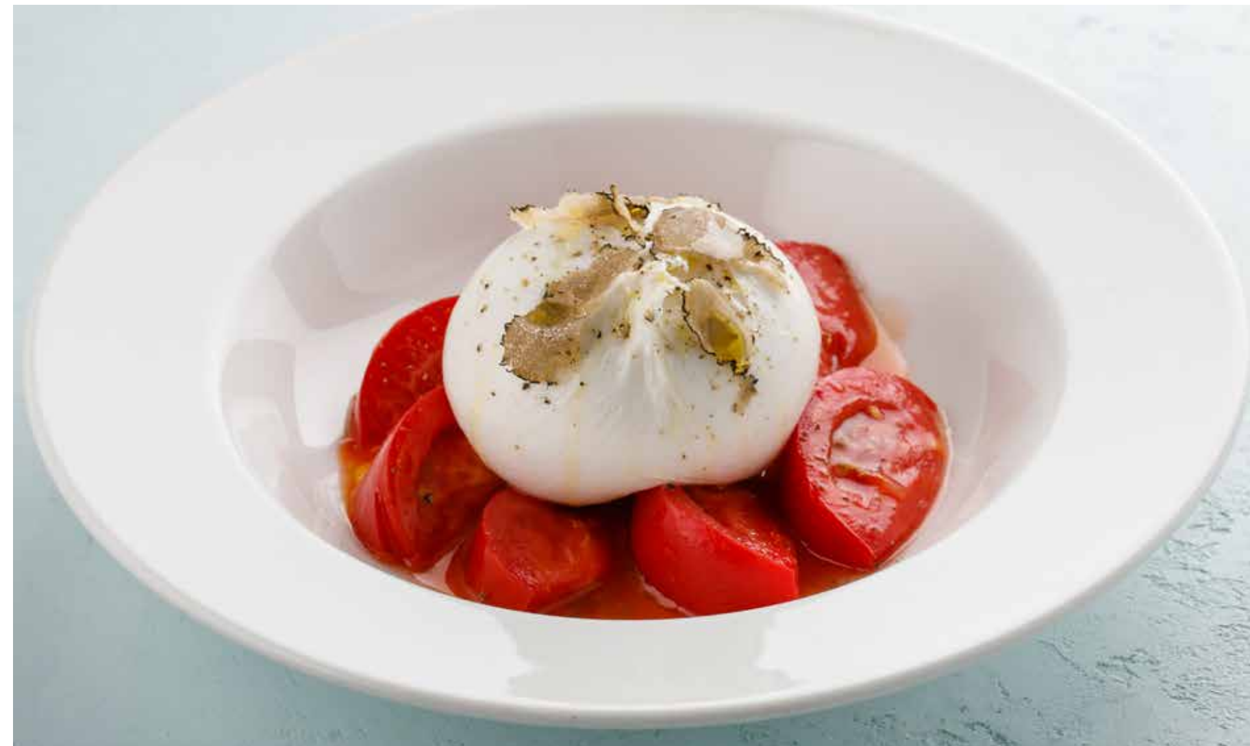
БУРРАТА С ТОМАТАМИ И ТРЮФЕЛЕМ BURRATA WITH TOMATOES AND TRUFFLE