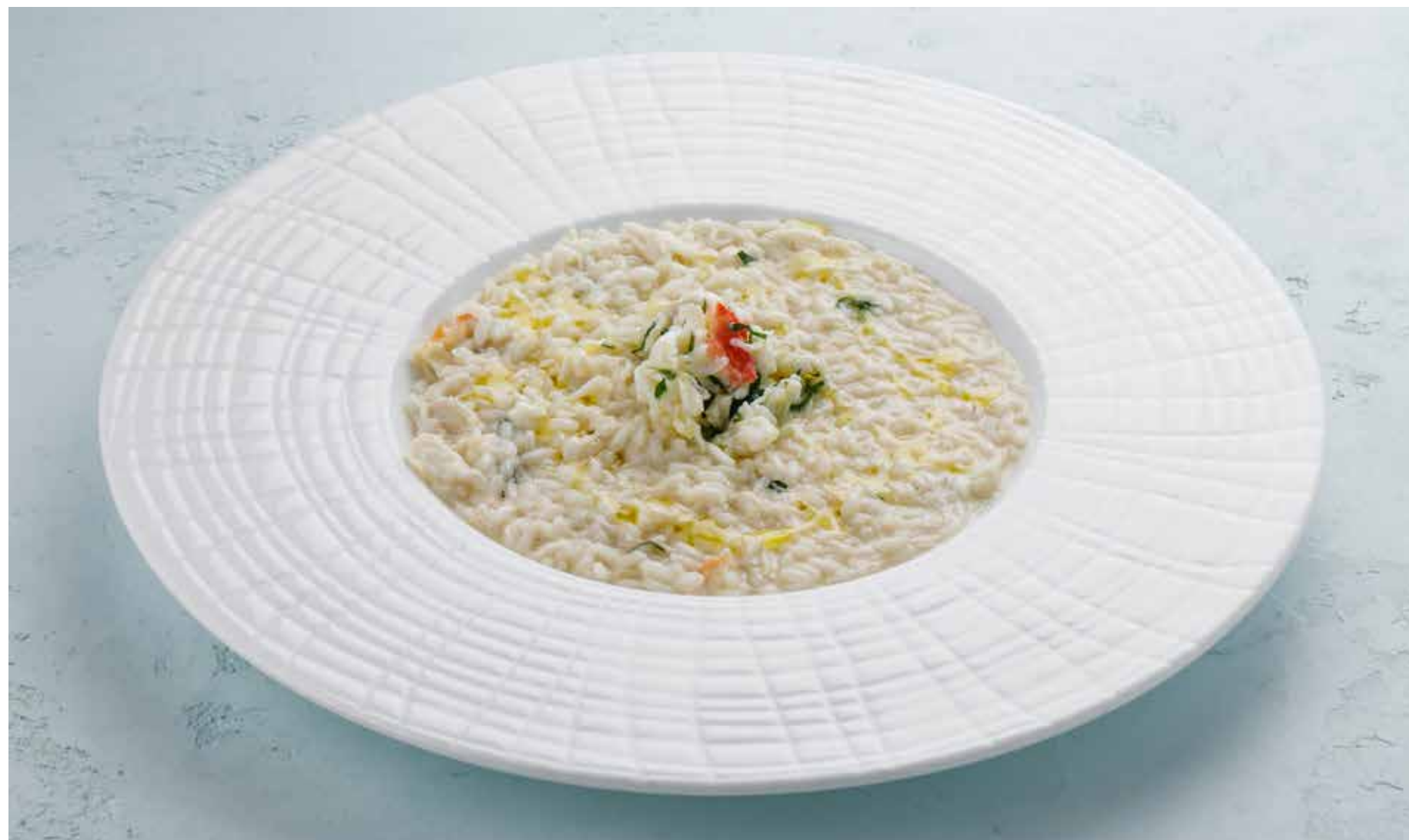
РИЗОТТО С КАМЧАТСКИМ КРАБОМ RISOTTO WITH KAMCHATKA CRAB