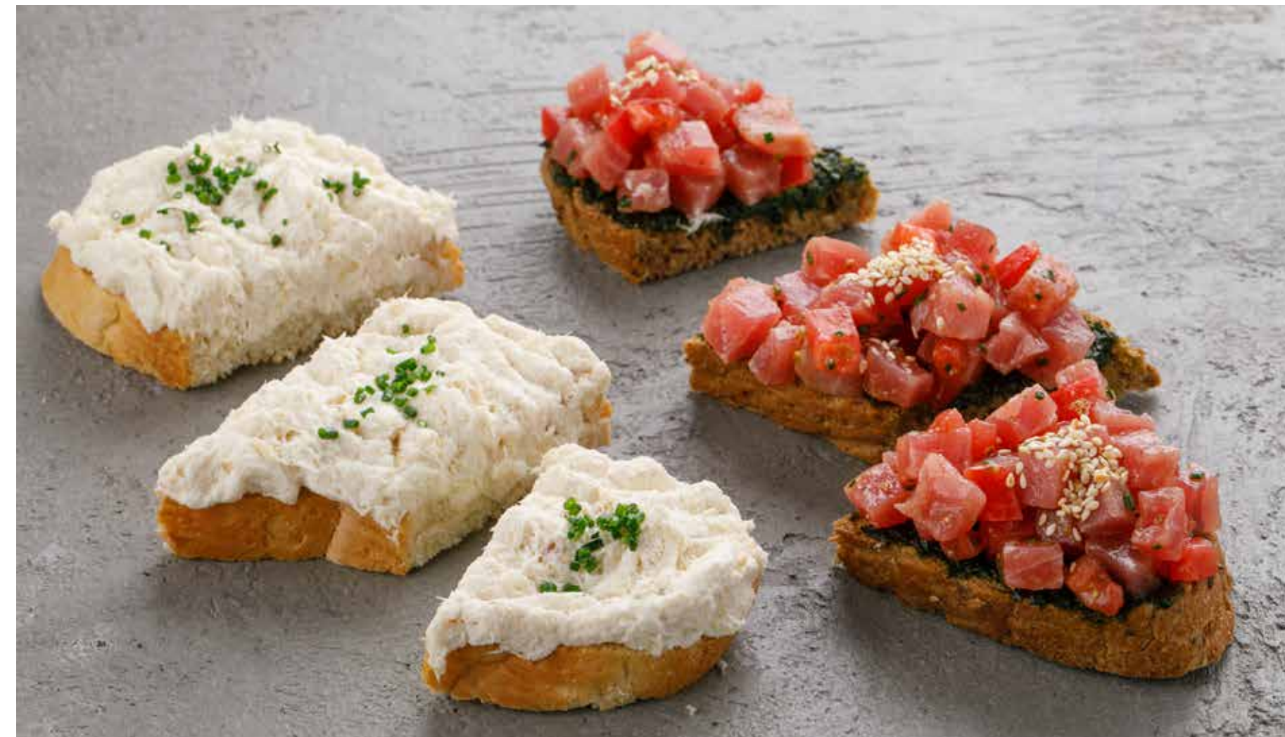
БРУСКЕТТА С КОПЧЕНОЙ ТРЕСКОЙ 690 ₺ BRUSCHETTA WITH SMOKED COD