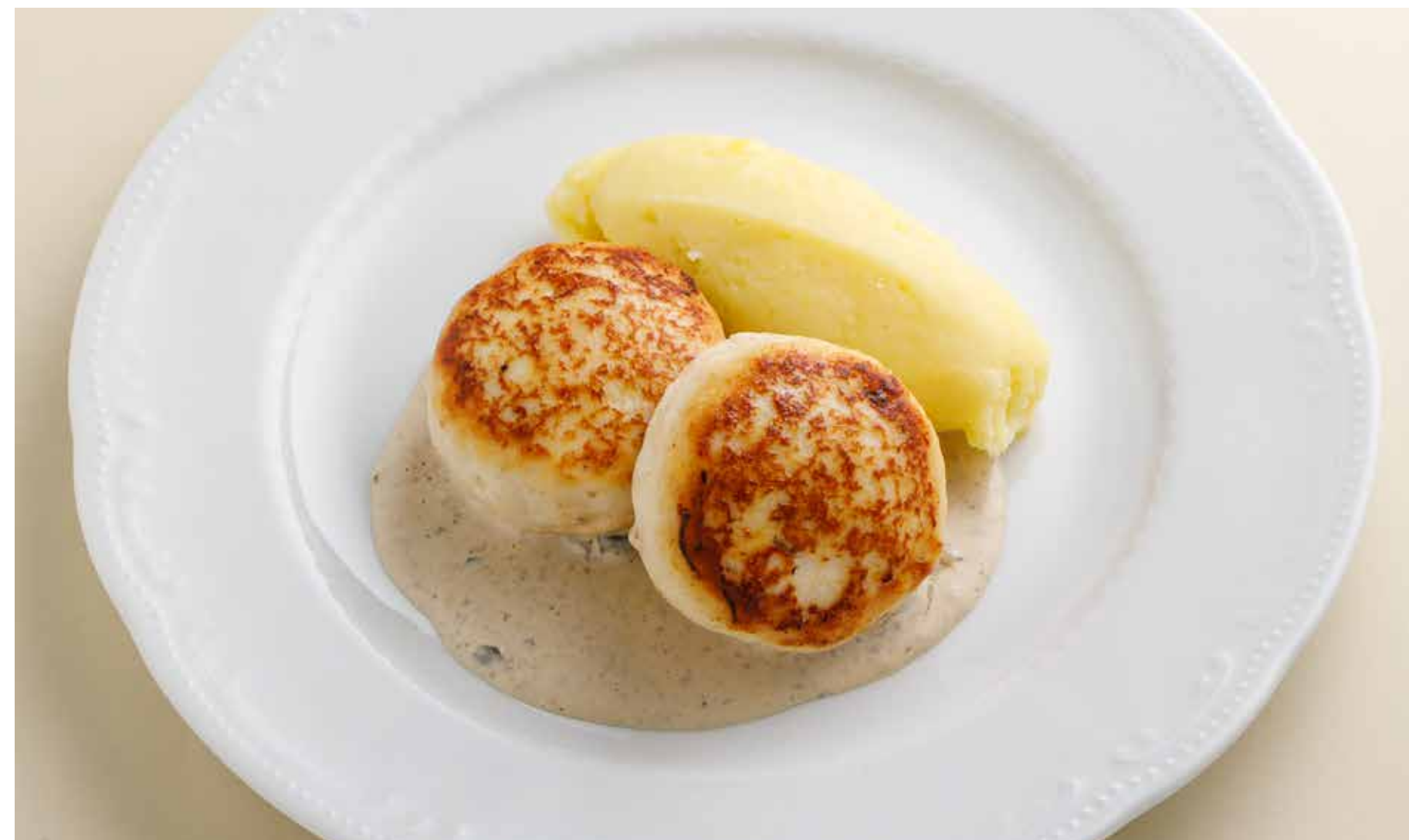
КОТЛЕТЫ ИЗ ИНДЕЙКИ С ГРИБНЫМ СОУСОМ TURKEY PATTIES WITH MUSHROOM SAUCE