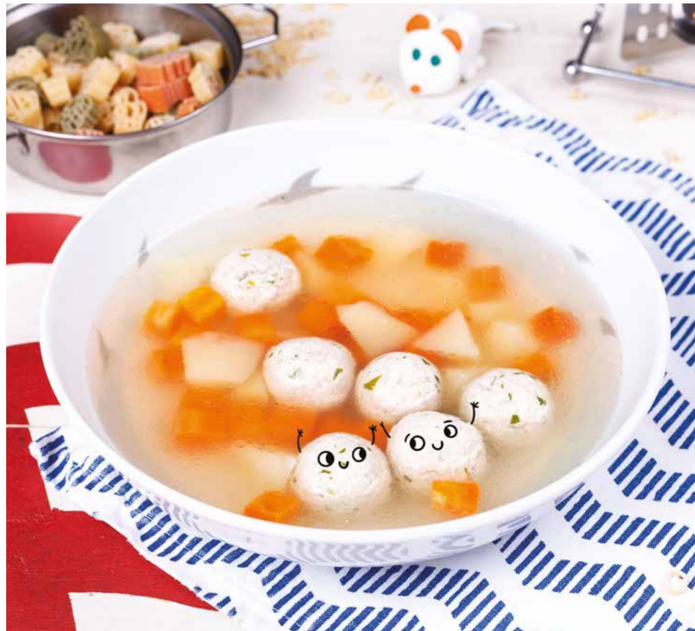
СУП С ФРИКАДЕЛЬКАМИ ИЗ ИНДЕЙКИ