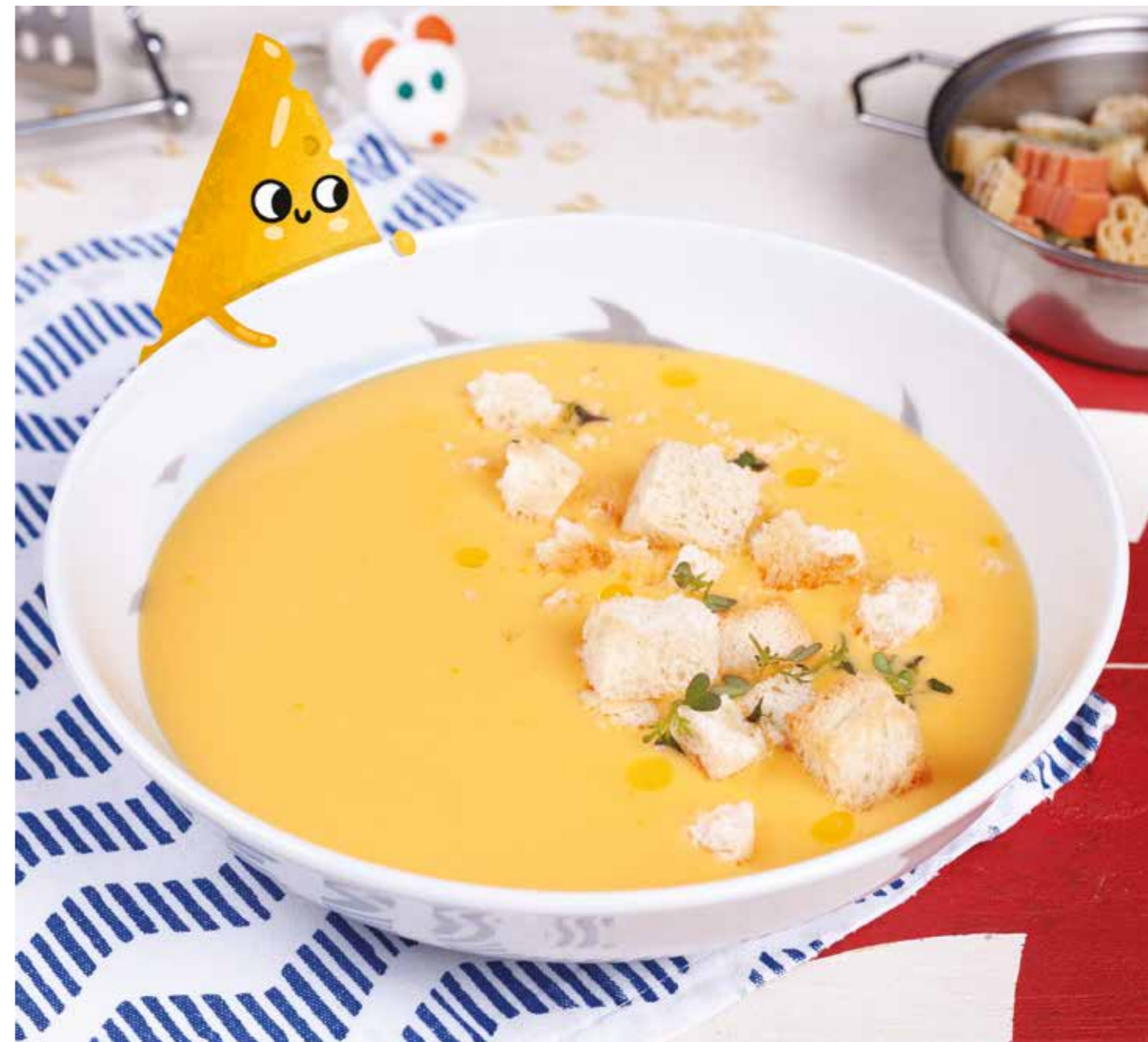
СЫРНЫЙ СУП С ГРЕНКАМИ