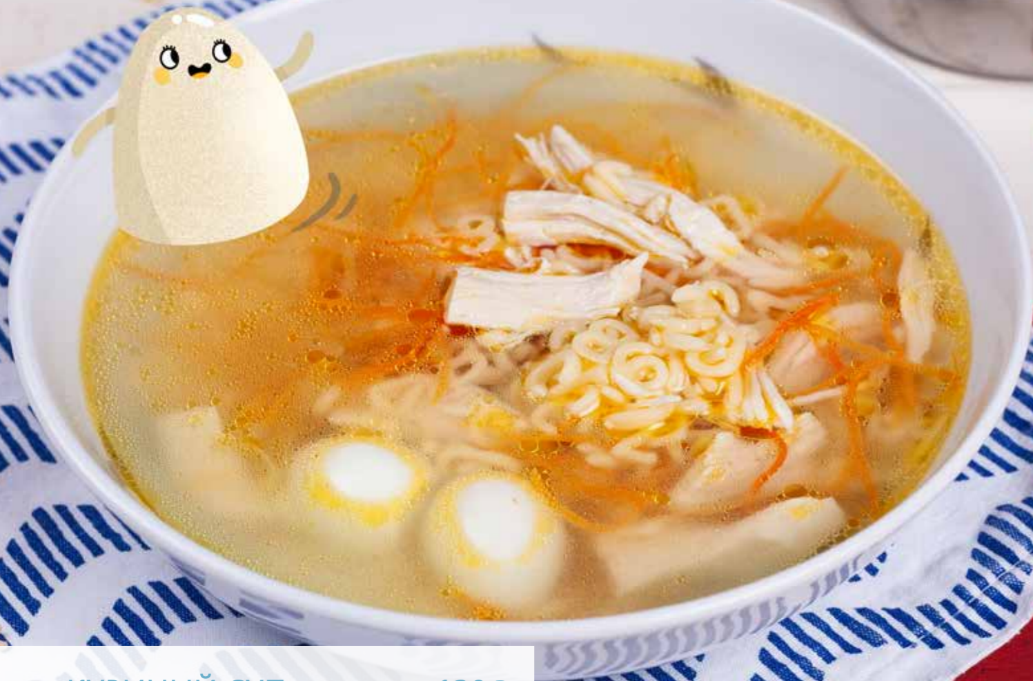
КУРИНЫЙ СУП С МАКАРОНАМИ