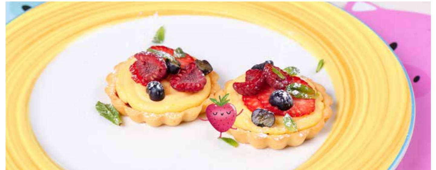
ПЕСОЧНОЕ ПИРОЖНОЕ С ЯГОДАМИ (с джемом на выбор: малиновым или черничным)