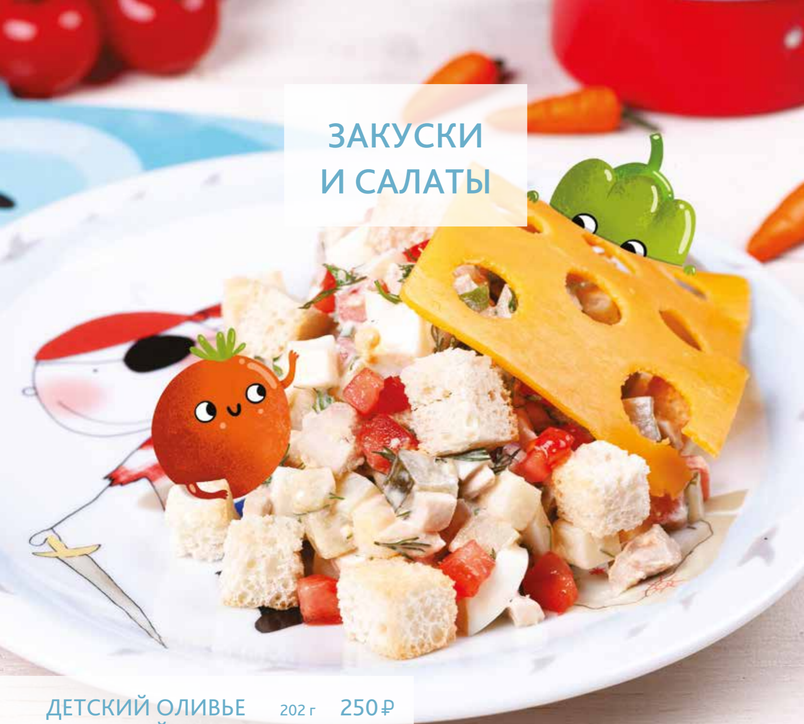
ДЕТСКИЙ ОЛИВЬЕ С КУРИЦЕЙ 202 г 250 ₺