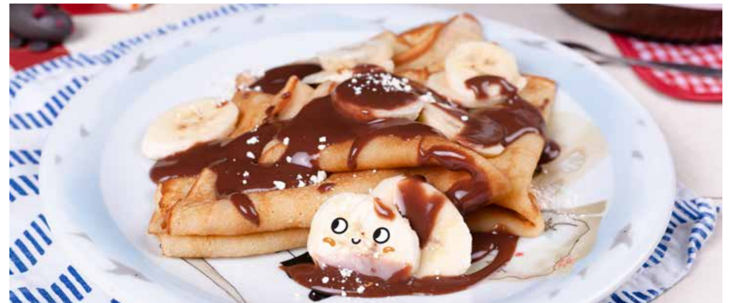
БЛИНЧИКИ С «НУТЕЛЛОЙ» И БАНАНОМ