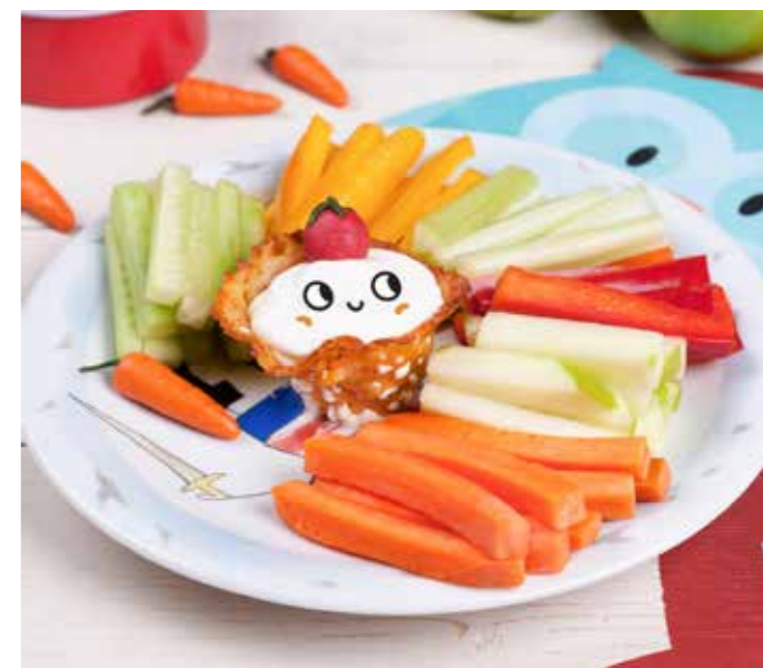
ОВОЩНЫЕ ПАЛОЧКИ 285 г 330 ₺