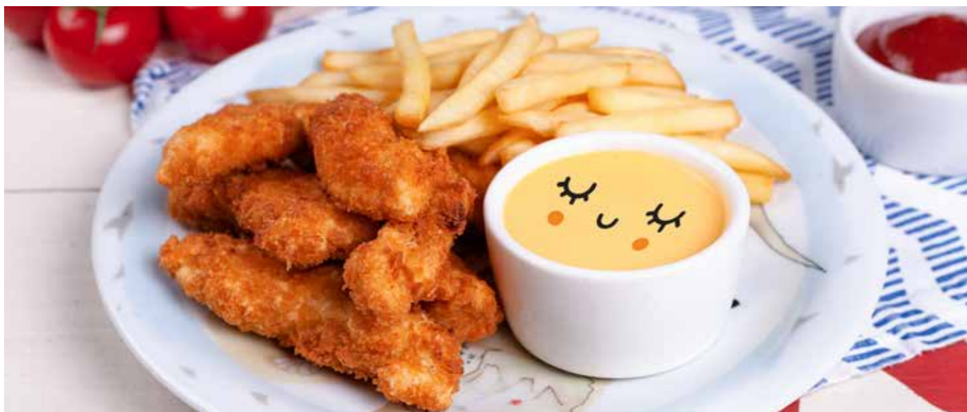
КУРИНЫЕ НАГЕТСЫ С СЫРНЫМ СОУСОМ