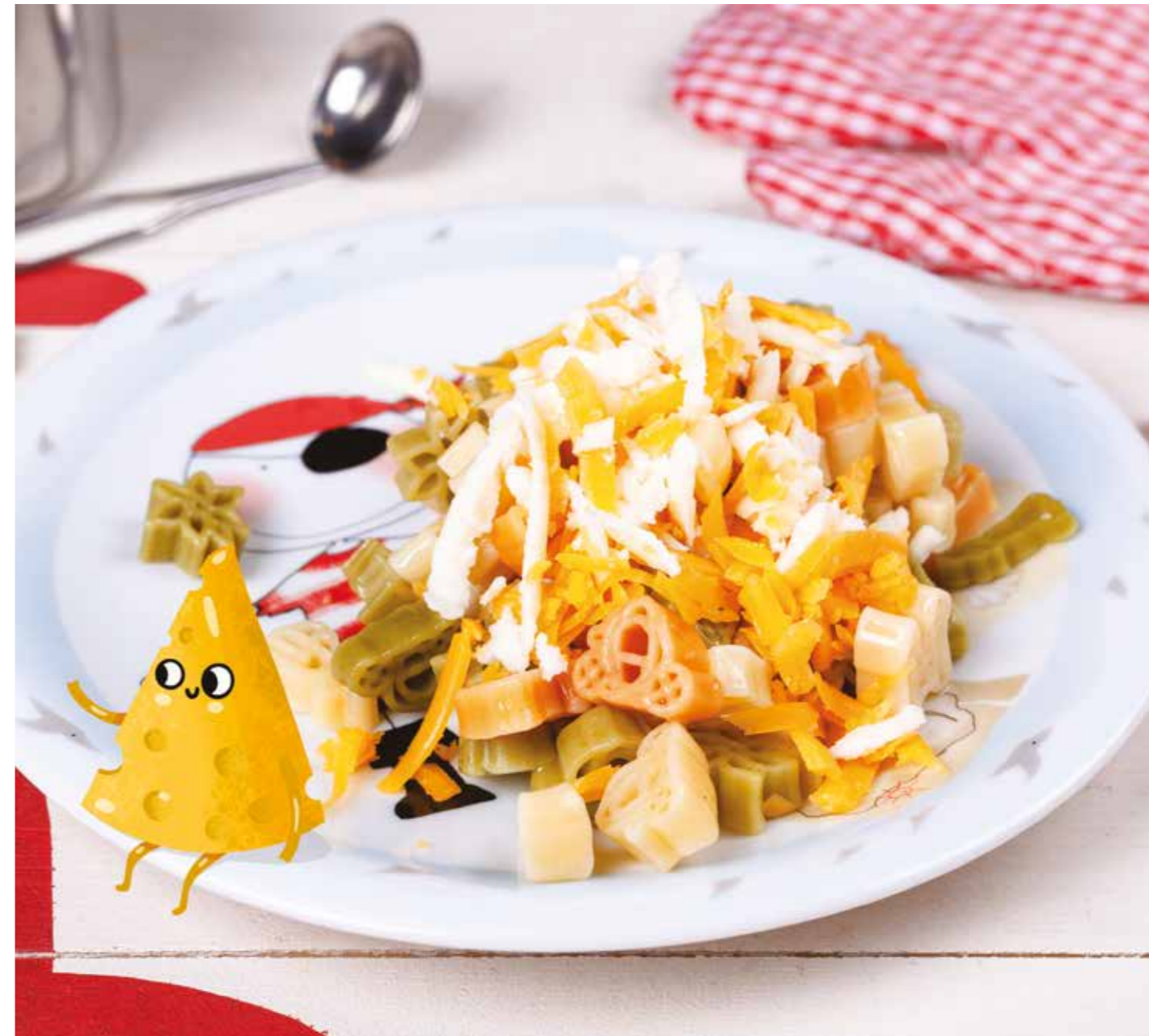
ДЕТСКИЕ МАКАРОНЫ С СЫРОМ