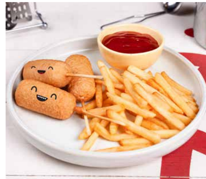
КОЛБАСКИ ИЗ СКАЗКИ