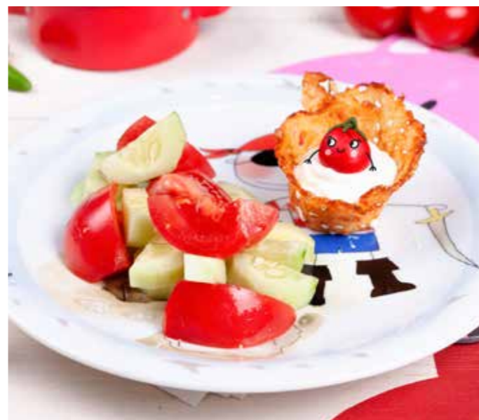
ДЕТСКИЙ ОВОЩНОЙ САЛАТ 205/20 г 330 ₺